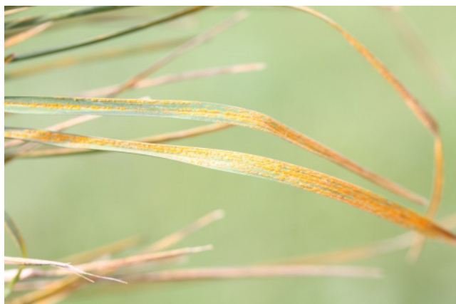
Billede 3. Gulrust i engrapgræs. Her sidder sporehobene i striber.

Kontakt din lokale rådgivningsvirksomhed , hvis du vil vide mere om dette emne.