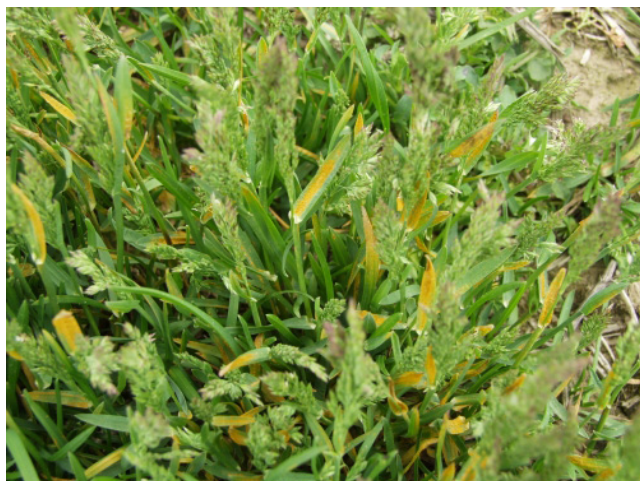
Billede 1-2. Rust i engrapgræs. Så længe sporehobene ikke sidder i striber, kan det være svært at afgøre, om der er tale om engrapgræsrust eller gulrust.